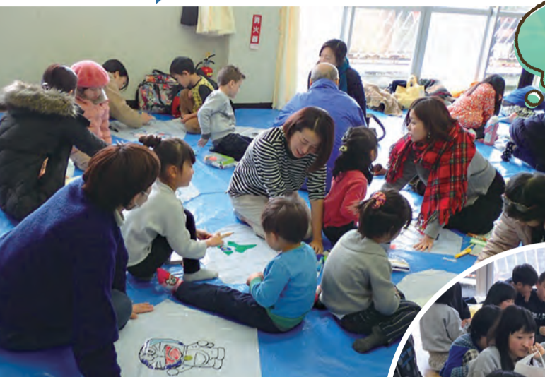
お母さんと一緒に凧づくり。 高く上がるといいなあ～！