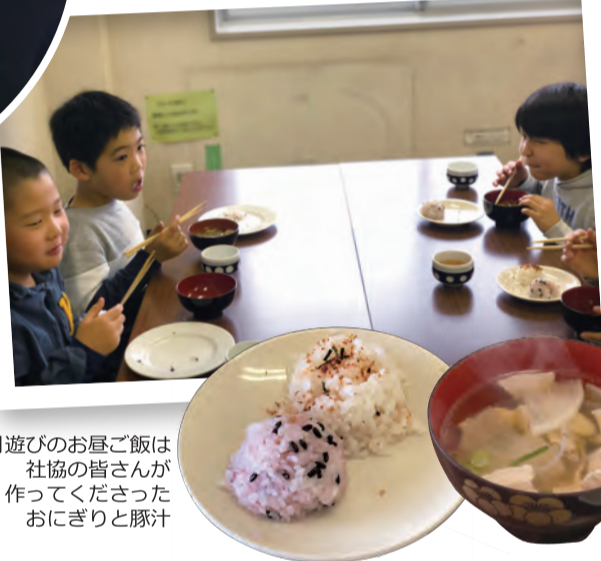
お正月遊びのお昼ご飯は 社協の皆さんが 作ってくださった おにぎりとお汁

1月5日と6日「お正月遊び」と「書初め教室」が開催されました。毎年参加している子ども達も多く、冬休み中で久しぶりに友達に会える事もあり、みんな大盛り上がりです。 お正月遊びでは、未就学児はビニール製のぐにゃぐにゃ凧を、小学生は六角凧を作りました。今年はいにくの天気で、凧揚げはできなかつたので急遽室内ゲームをして遊び、昼食は豚汁とおにぎりを美味しくいただきました。 6日の「書初め教室」は冬休みの宿題にする子もあり毎年人気があります。先生にお手本を書いていただいて、みんな一生懸命に筆を走らせます。冬休み最後の一日を有意義に過ごしました。