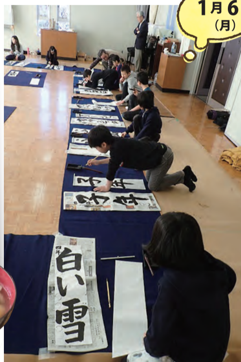
長い毛氈を敷いてみんなで並んで書きます。