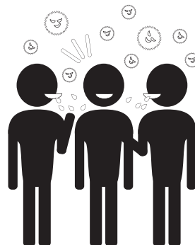
間近で会話や発声 密接場面