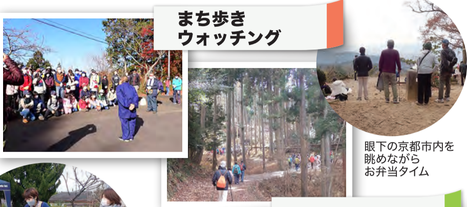
まち歩き ウォッチング