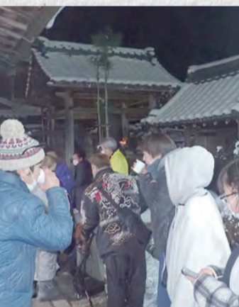
温かいお茶をいただきました

何段もある階段を登って御参り。なんだかすごく利益があるよな気がします! 皆さんもエクササイズがてらぜひ。