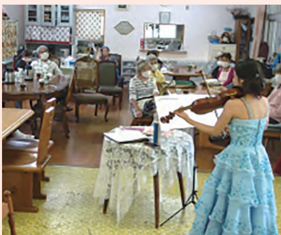
ヴァイオリニストによるミニコンサート

期とします。子どもの土曜日の有意義な過ごし方に着目して、食事の提供(いわゆる「子ども食堂」と学習支援(いわゆる「寺子屋教室」)を足して2で割る形で始めたこの「土曜ばカフエ」(おとなと子どもの遊びば学びば)ですが、地域の協力と大津市社協の助成金を得て、コロナの状況を見極めながらこれから進めていきたいと思います。